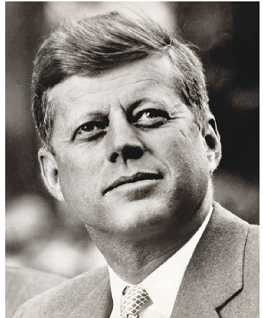
John F. Kennedy

wurde 1946 in den Kongress gewählt, er wurde 1960 Präsident der USA